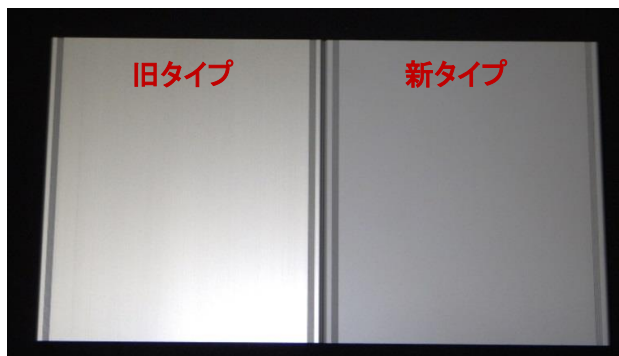
【カバーフレーム(上下カバー)】