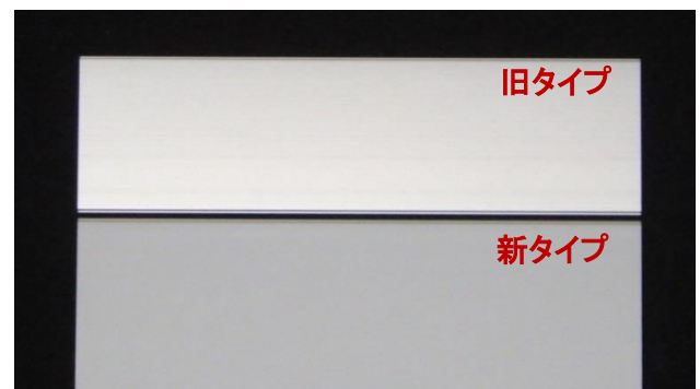
【パネルフレーム(Hフレーム)】